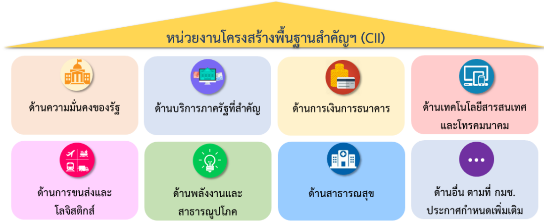
ภาพที่ 2 ประเภทหน่วยงานโครงสร้างพื้นฐานสำคัญทางสารสนเทศ

Critical Information Infrastructure : CII