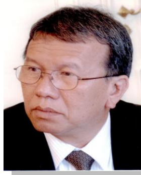
นายสุรจิต ชिरเวทย์ สมาชิกวุฒิสภา กรรมการ