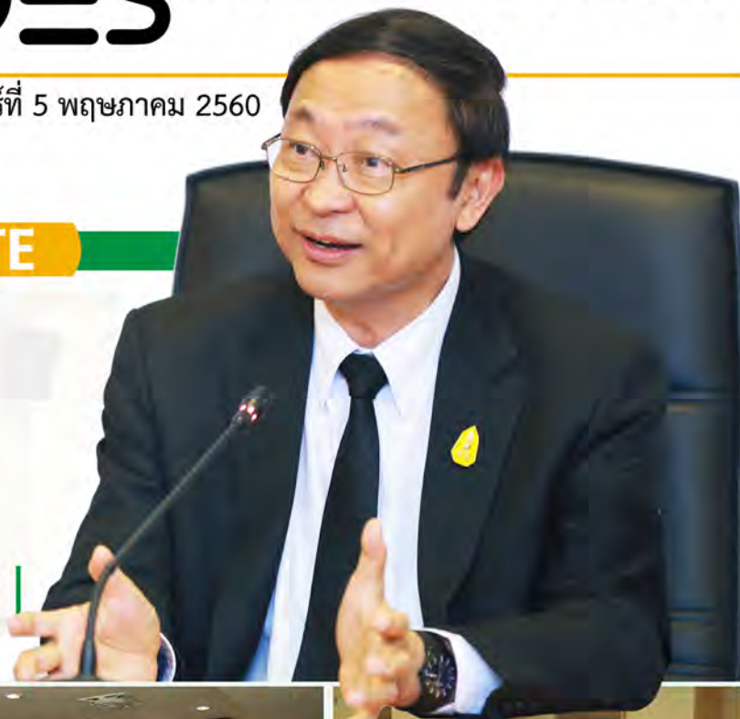
ดร.วิเชษฐ ดุรงคเวโรจน์ รัฐมนตรีว่าการกระทรวงดิจิทัลเพื่อเศรษฐกิจและสังคม